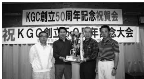
50周年記念大会成績表

ひと昔前と違って各団体ゴルフクラブの会員数も年々減少しております。小さな村でこのような立派なゴルフ場があるにもかかわらず、大変残念なことです。北山ゴルフクラブにおいては現在50名(最盛期には120名以上)