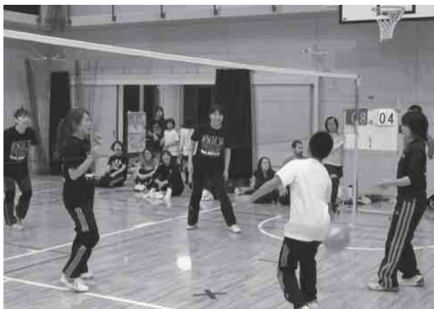
平成25年度 秋季ソフトバレーボール交流大会 成績表

今回のルールは、試合に女性が2名以上出場することで、ハンデを設けましたが、対戦結果は試合巧者のママさんバレーボールチームが優勝しました。