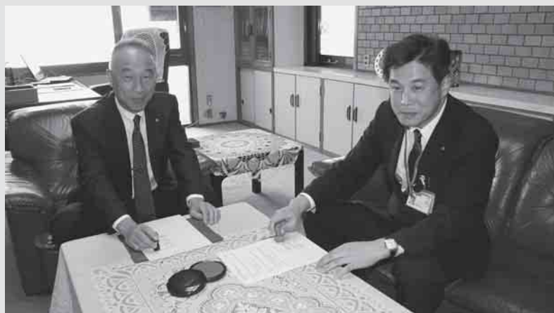
下北山郵便局長と村長が調印