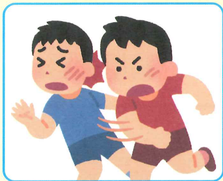
ケンカや暴力行為による負傷