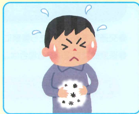
購入品や飲食店などでの食中毒