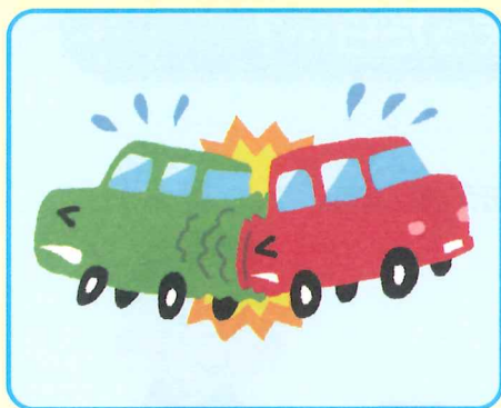
交通事故(車同士やバイク等)