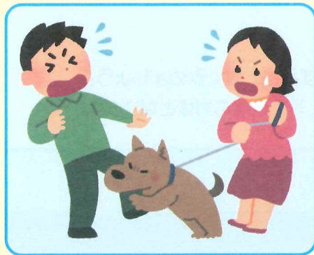
他人のペットによる負傷