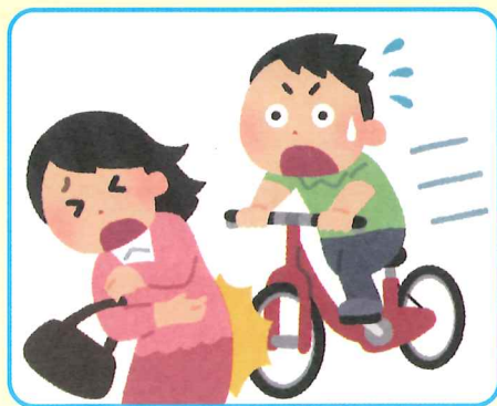
自転車による事故