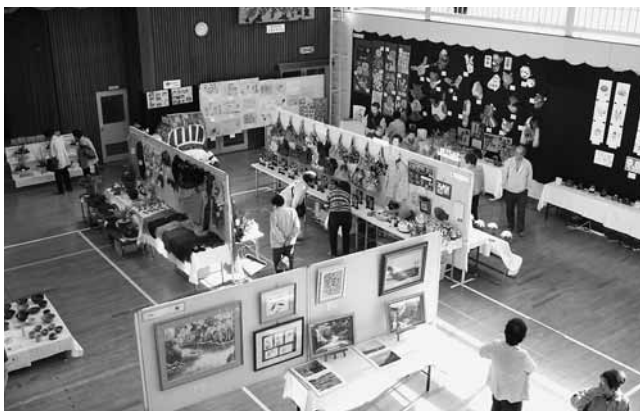
力作が並びました