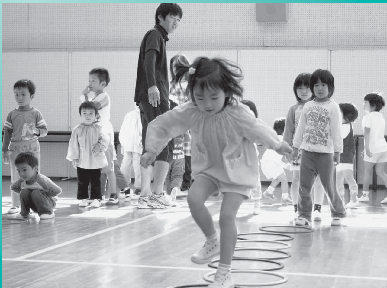
保育所体操教室より

発 行 下北山村役場 〒639-3803 奈良県吉野郡下北山村大字寺垣内983番地 (代)07468-6-0001 http://www.vill.shimokitayama.nara.jp/