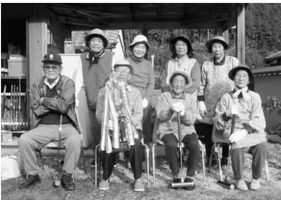
優勝した寺垣内チーム