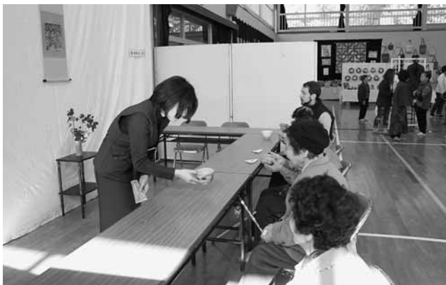
茶道教室生による呈茶