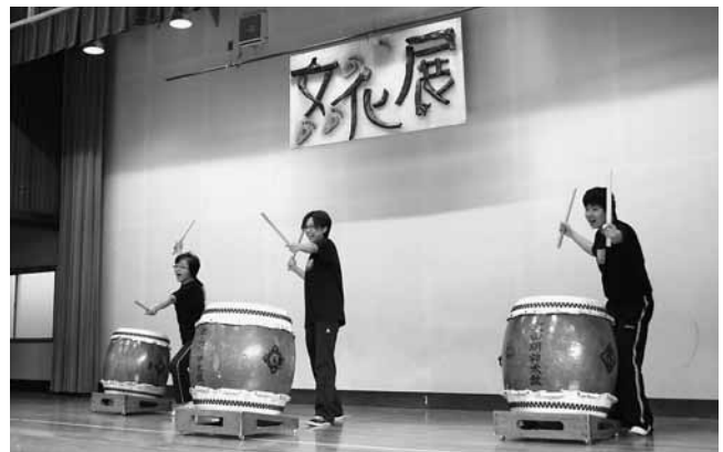
和太鼓教室生の演奏