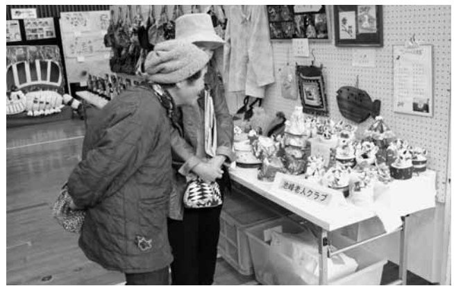
よくできてるねー